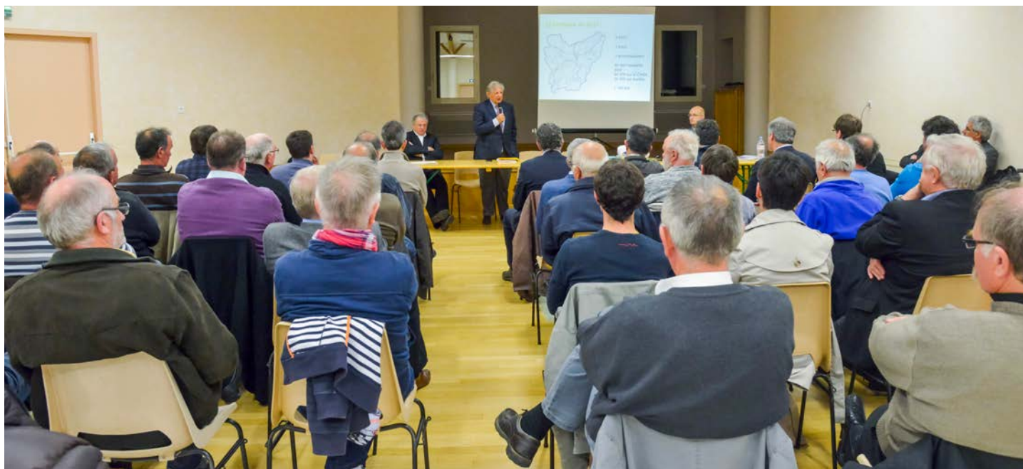
Réunion publique de présentation

Enfin, le SCoT est porteur d'objectifs de maîtrise de la consommation foncière, pour tendre vers une réduction d'environ un tiers de la consommation d'espaces naturels et agricoles. Poursuivre et dynamiser le développement du territoire en consommant moins de foncier : tel est l'objectif ambitieux recherché par le projet de SCoT.