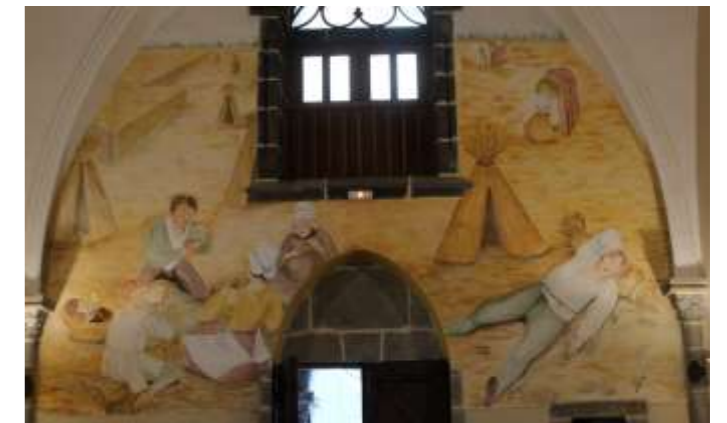
Fresque représentant la période de la moisson

L'édifice à clocher-porche, surmonté d'une flèche est un vaisseau unique avec deux chapelles latérales et un chœur pentagonal à fausses-voûtes d'ogives. L'ensemble semble cohérent malgré les phases de reconstruction. Traitée de manière néo-classique transposée dans un vocabulaire néo-gothique, l'architecture est en parfaite harmonie avec le mobilier. Contrairement au gothique « flamboyant » en usage dans la seconde moitié du XIXe s, le style employé ici est simple et empesé.