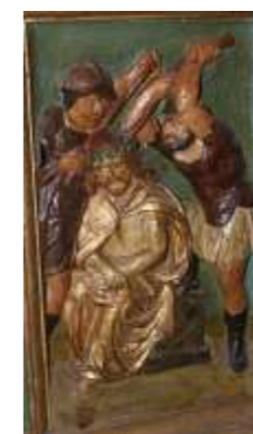
Panneau 03 : couronnement d'épines

Au-dessus de ces panneaux courent deux bandeaux ornés de têtes d'anges ailées