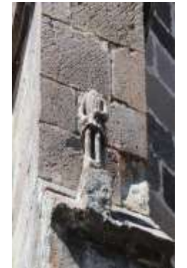
contrefort Nord du chœur - détail